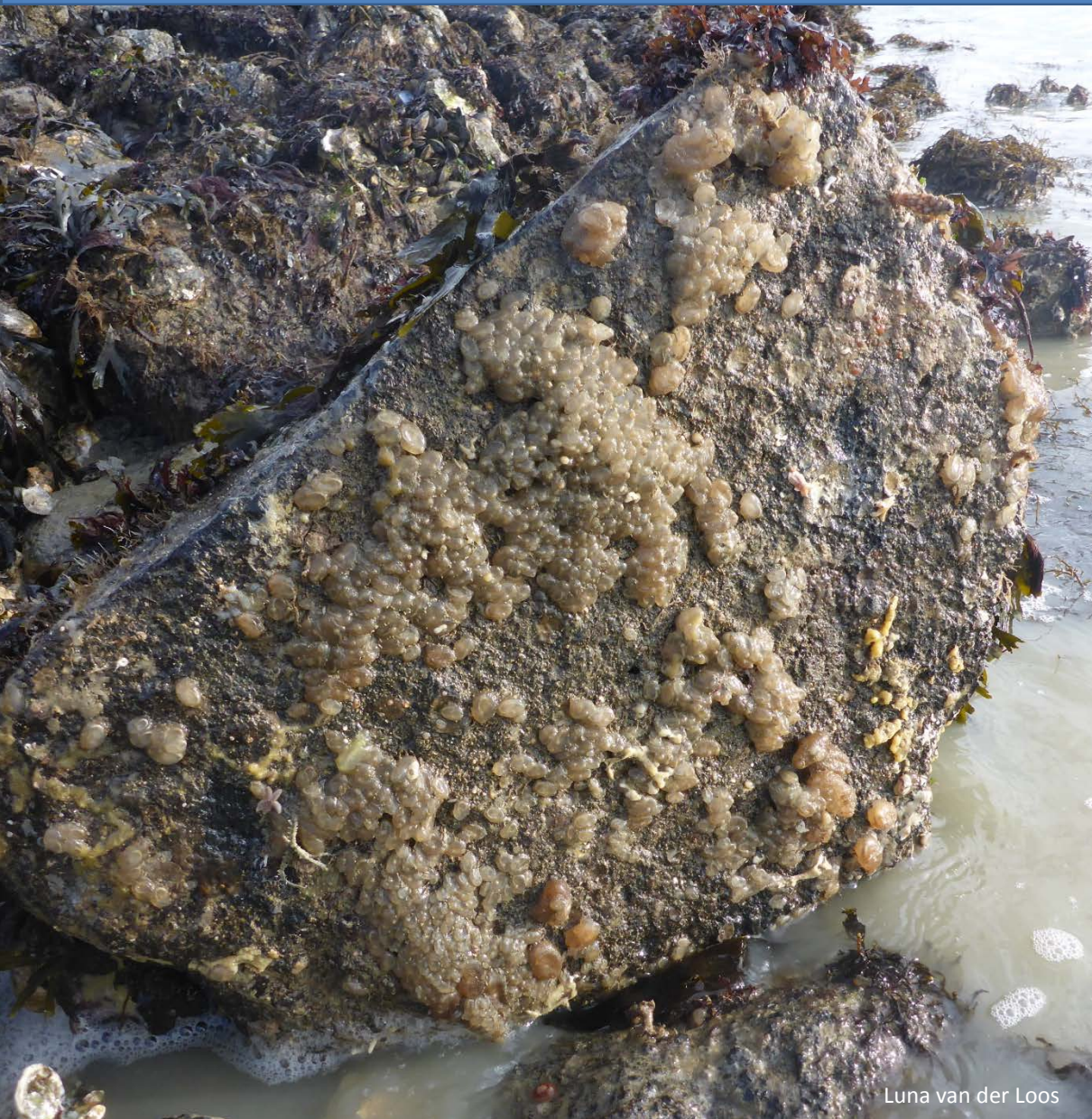
Luna van der Loos