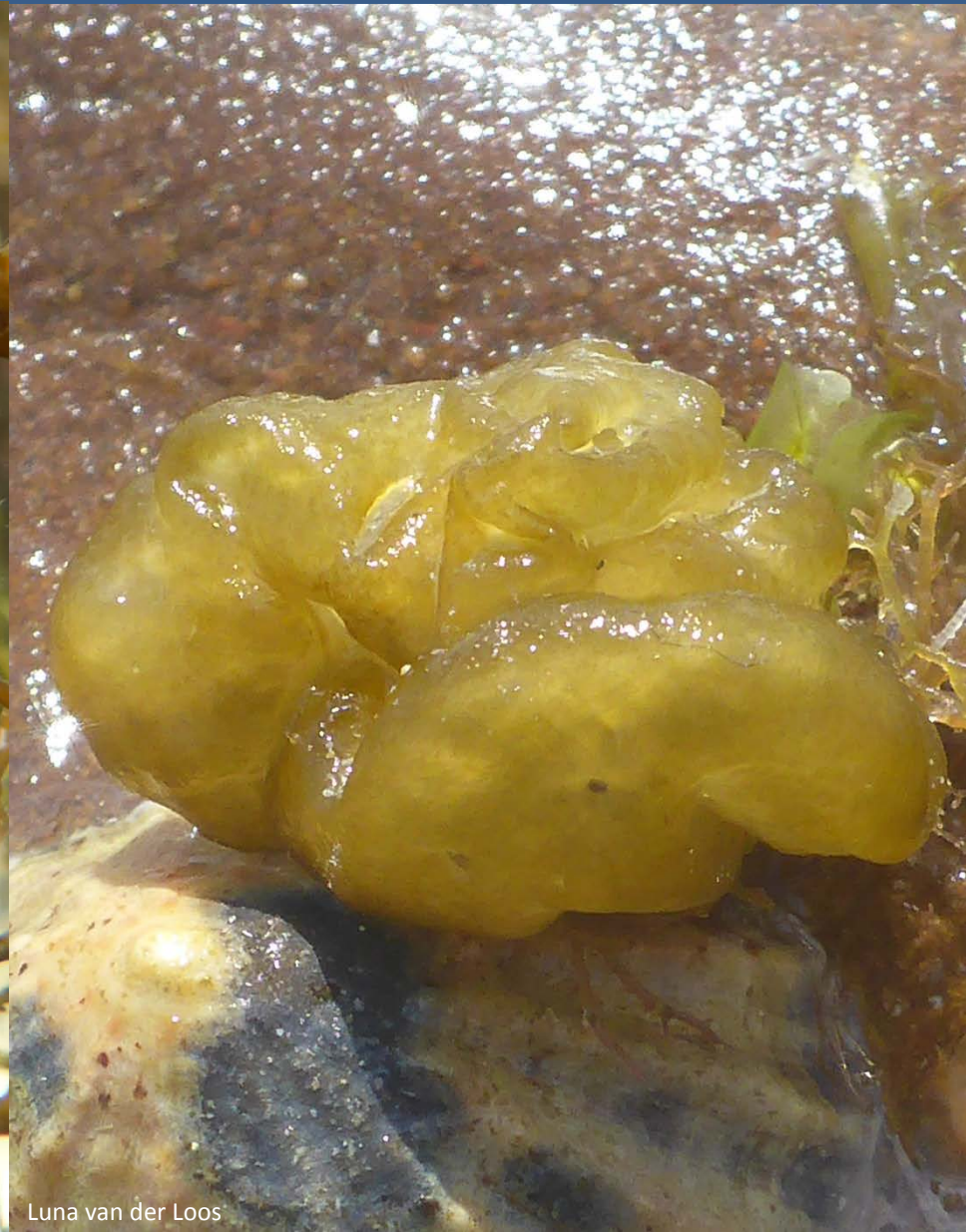
Luna van der Loos