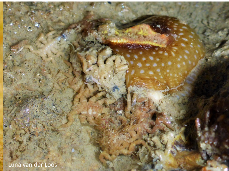
Luna van der Loos