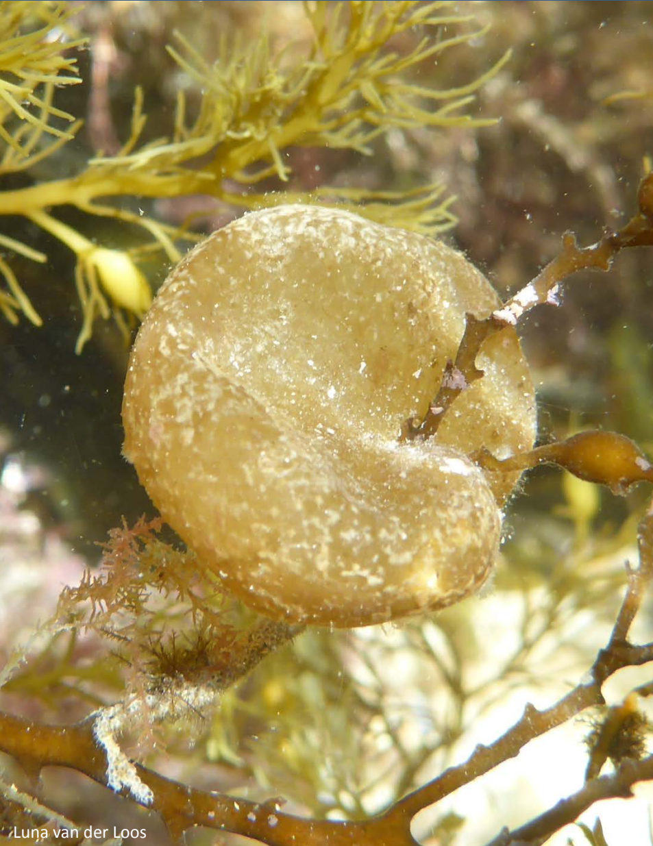
Luna van der Loos