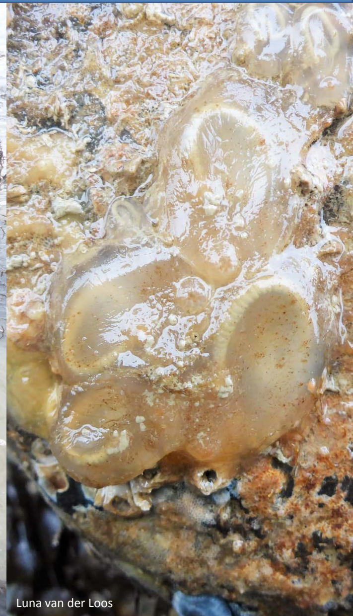
Luna van der Loos